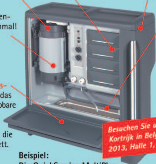
Beispiel: Die QuickService MultiPlus

Große Arbeitsfläche durch das dreiseitig klappbare Frontsystem. Gleichzeitig verschließt es die Küche komplett.