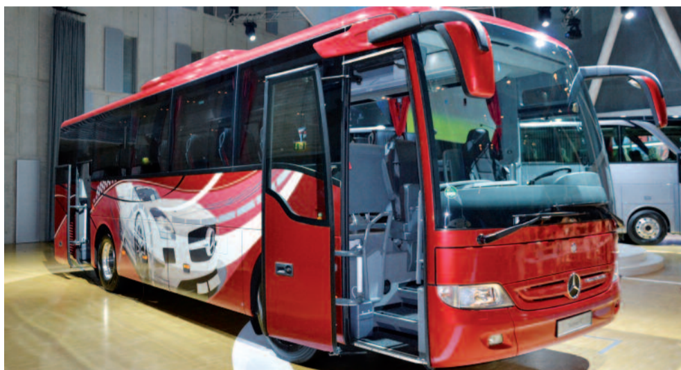
Der neue kleine Turismo K – ganz groß.

schiedene Küchenvarianten empfiehlt sich der in der Türkei gebaute Turismo K als hochwertiges